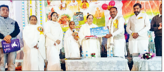
भिवानी। बाबा कमाल मंदिर में कार्यक्रम में विधायक को सम्मानित करते बिके भाई बहन।