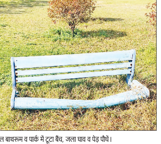
भिवानी। चौधरी सुरेंद्र सिंह मेमोरियल पार्क में खस्ताहाल बाथरूम व पार्क में टूटा बैच, जला घाव व पेड़ पौधे।