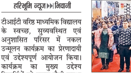
हरिभूमि न्यूज ►► भिवानी