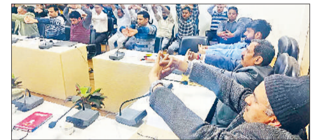
चरखीदादरी। योग ब्रेक में योग अभ्यास करते कर्मचारी।

लघु सचिवालय में हरियाणा योग आयोग, आयुष विभाग तथा जिला प्रशासन के संयुक्त तत्वावधान में डीसी डॉ मुनीश नागपाल सहित विभिन्न अधिकारियों और कर्मचारियों ने योगा वाई ब्रेक के दौरान आयुष विभाग के योग सहायकों द्वारा योगाभ्यास करवाया गया। डीसी डॉ नागपाल ने उपस्थित अधिकारियों व कर्मचारियों को नियमित रूप से योग अभ्यास करने