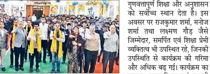
भिवानी। विद्यार्थियों व शिक्षकों को नकल रहित परीक्षा का संकल्प दिलवाते अतिथि।

मुख्यतिथि पहुंचे। विद्यालय परिवार ने उनका सादरीपूर्ण एवं सम्मानजनक स्वागत किया। उन्होंने कक्षा दसवीं और बारहवीं के विद्यार्थियों को नकल के दुष्परिणामों से अवगत करवाते हुए कहा कि नकल व्यक्ति के ज्ञान, चरित्र और भविष्य को कमजोर बनाती है। उन्होंने विद्यार्थियों को आत्मविश्वास,